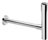
Ozdobny syfon umywalkowy